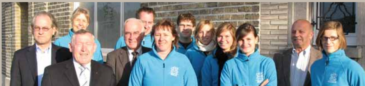
Met bestuursleden en staf van BVLO voor het secretariaat in Sint-Amandsberg eind 2009.